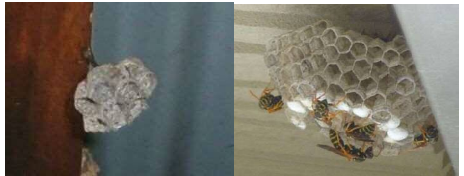
初期のころのアシナガバチの巣

アシナガバチの巣は灰色(巣の材料によっては白色や茶色)で、シャワーヘッドのような形をしており、下から見ると六角形の穴が多数あいています。